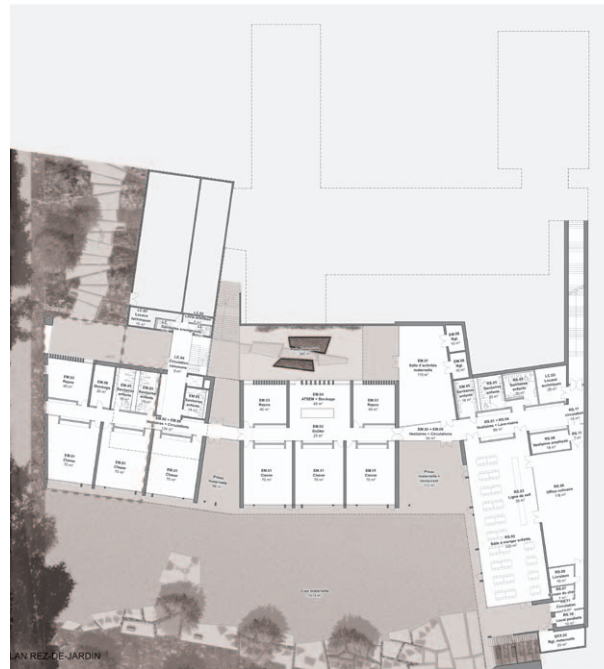
plan du niveau rez-de-jardin